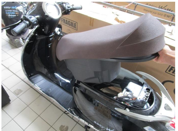
sortir la selle et son bac