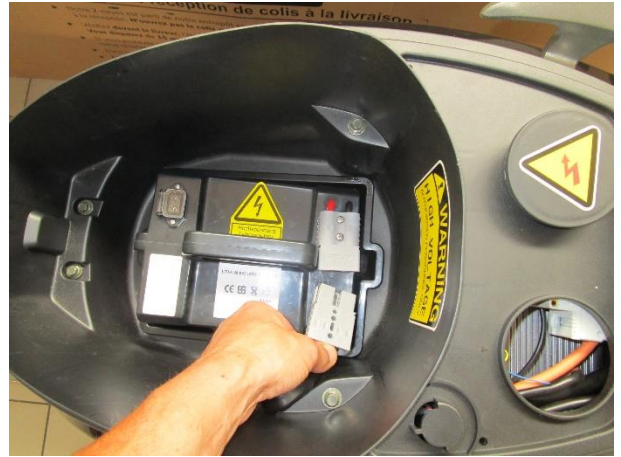
débrancher la batterie et la sortir