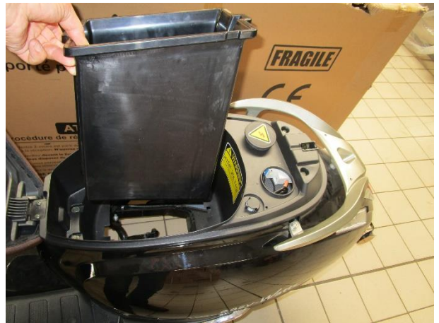
sortir le bac