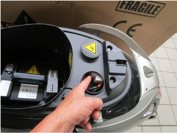
Couper le disjoncteur