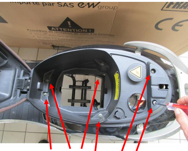
Dévisser les 6 vis