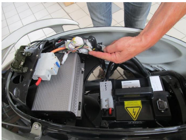
Le connecteur à 1 fils vert/ jaune d'un côté et violet de l'autre